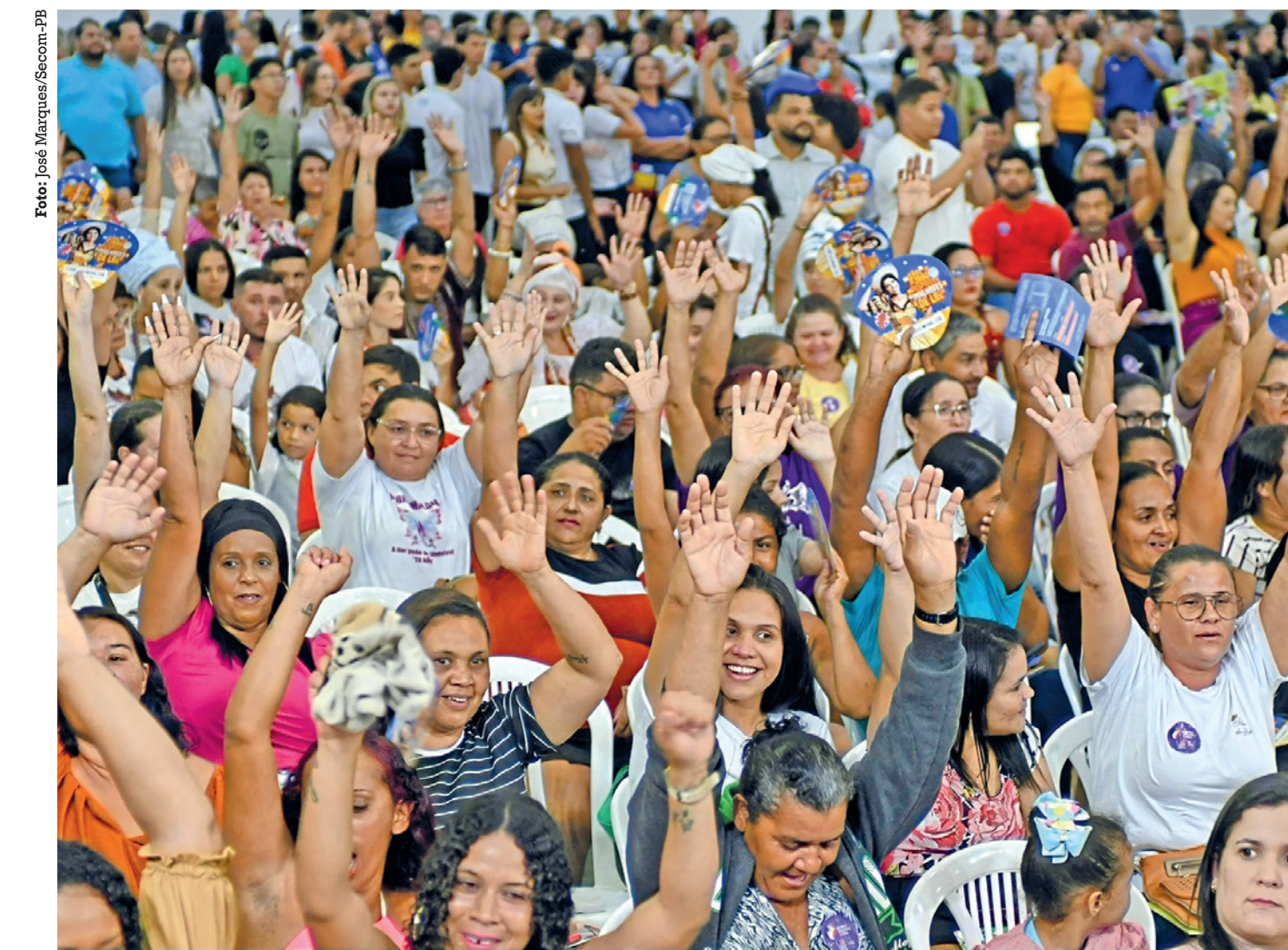
A população de Patos e região lotou o Ginásio “O Gelão”, ontem, à noite, na plenária do Orçamento Democrático Estadual

Só em iniciativas voltadas à educação, os investimentos totalizam R$ 62,7 milhões, no período de 2023 e 2024. Entre as obras concluídas, destacam-se a construção do ginásio e manutenção da Escola Auzanir Lacerda, em Patos; aquisição de equipamentos e mobiliário para 37 escolas estaduais da região, beneficiando 10.938 estudantes e 936 professores; e construção do novo prédio da Escola Professor João Noberto, em Santa Terezinha, além de convênios para o transporte escolar de estudantes, alimentação escolar, climatização, reformas e ampliação de diversas escolas da região. Na área de desenvolvimento econômico foram investidos R$ 23,8 milhões, incluindo iniciativas voltadas à oferta de 37.400 refeições por mês, pelo Programa “Tá na Mesa”, Cartão Alimentação para 2.005 famí-