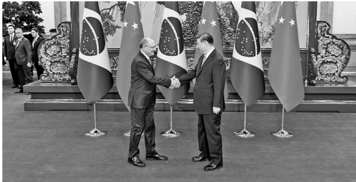
Alckmin (esquerda) e o presidente chinês, Xi Jinping, fortalecem relações bilaterais em reunião da Cosban

As plenárias da Cosban, sofisticado mecanismo de negociação bilateral Brasil-China, acontecem a cada dois anos; em 2026, o encontro ocorrerá no Brasil. "As reuniões bienais da Cosban são de grande relevância para manter abertos os canais de diálogo entre os dois governos, permitindo o aprofundamento de nossa parceria em uma vasta gama de projetos", afirmou o vice-presidente.