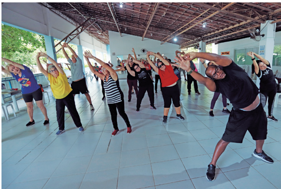
Professor diz que exercícios são fundamentais para essas pessoas por causa das mudanças