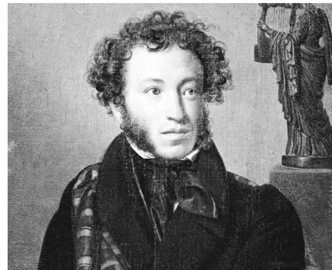
Púchkin: credita-se ao escritor o idioma russo moderno