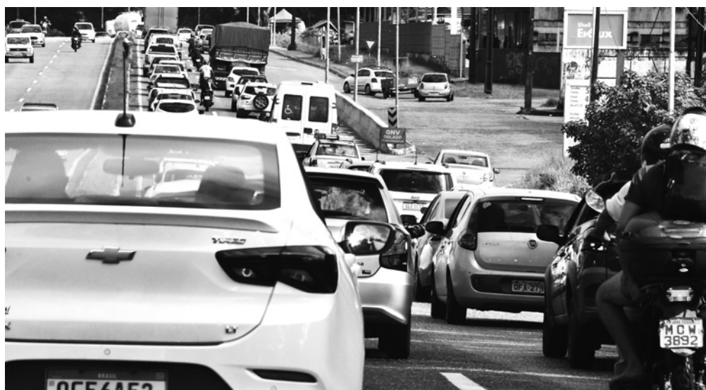
Considerando o acumulado do ano, houve queda de 1,7% ante o mesmo período de 2023

A avaliação da Anfavea é que as exportações continuam muito abaixo das expectativas. Em maio, foram exportadas 26,8 mil unidades, queda de 41,4% ante maio do ano passado e queda de 2,1% em relação a abril deste ano. No acumulado de janeiro a maio, as 136,3 mil unidades exportadas representaram recuo de 29,7% sobre igual período do ano passado, quando o número absoluto chegou a 193,8 mil.