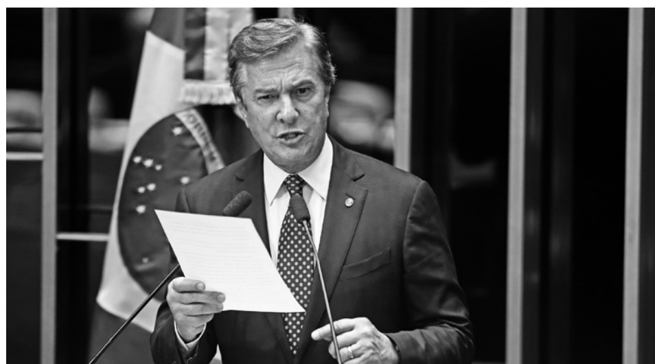
Collor foi condenado a oito anos e 10 meses por corrupção passiva e STF avalia recurso