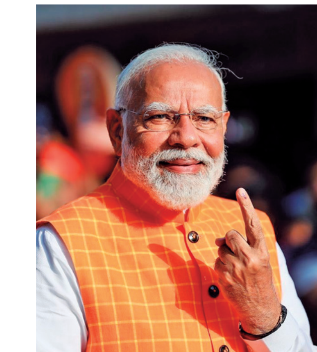
Partido de Modi não conseguiu obter maioria sozinho

Os resultados completos das eleições de seis semanas na Índia, que começaram em meados de abril, foram divulgados na última quarta-feira (5). O BJP conquistou 240 assentos,