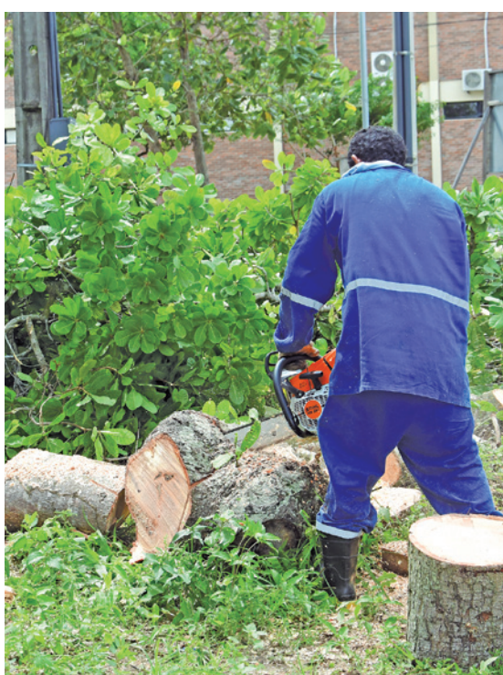
Para liberar a via, a árvore foi destrocada