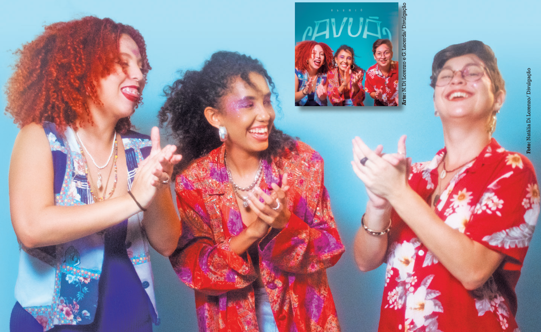
Arte: N. Di Lorenzo e G. Lacerda/ Divulgação

Trio formado por integrantes nascidas em Sapé ganhou o FMPB em 2023