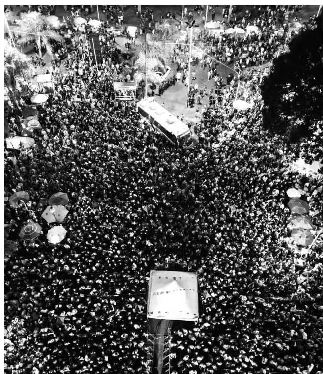
Festa junina acontece entre os dias 20 e 24 deste mês

As inscrições podem ser realizadas virtualmente, pelo site da prefeitura da capital, por meio da plataforma 1Doc ( https://joaopessoa.1doc.com.br/b.php?pg=wp/wp&itd=5 ), endereçadas ao setor “Se-