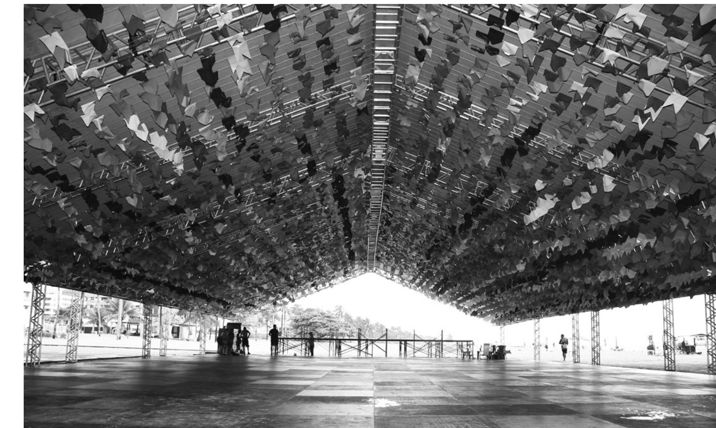
Uma arena de 10 mil m 2 , com capacidade para 15 mil pessoas, foi instalada na altura do Busto de Tamandaré

Ao todo, serão cinco dias de apresentações de quadrilhas juninas. Na área que irá receber o festival estão sendo montados o pavilhão, a arquibancada e 25 banheiros químicos. O local também conta