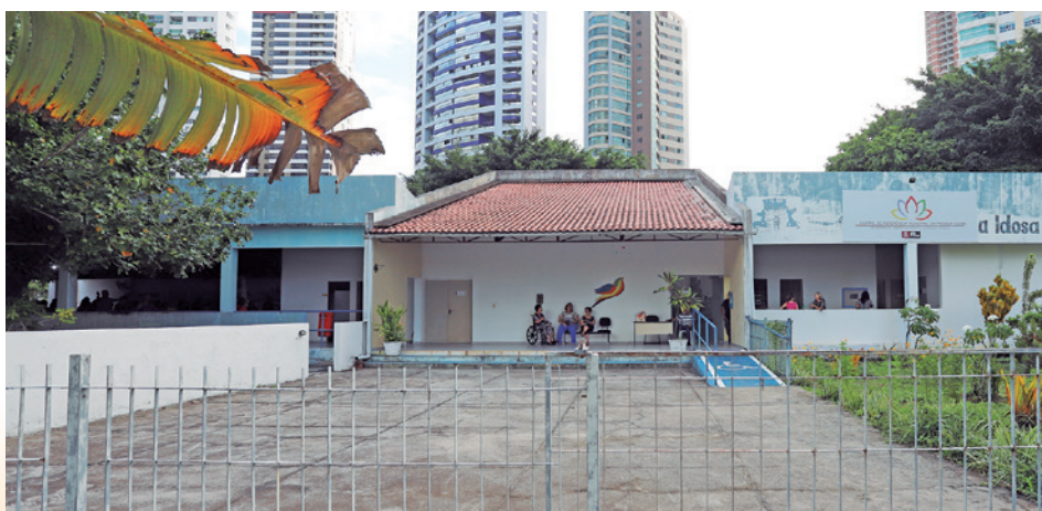
O espaço físico do Centro é vinculado ao Instituto de Previdência da capital

que além das atividades diárias, também são feitos eventos alusivos a datas comemorativas, como o Carnaval, Dia das Mães, São João, Dia dos Pais, Dia dos Avós, dentre outros. Segundo ele, atualmente, cerca de 520 idosos estão matriculados, com idades variando a partir dos 60 e chegando a mais de 90 anos.