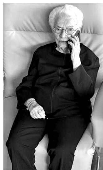
Deputada foi internada na quarta-feira, após falta de ar