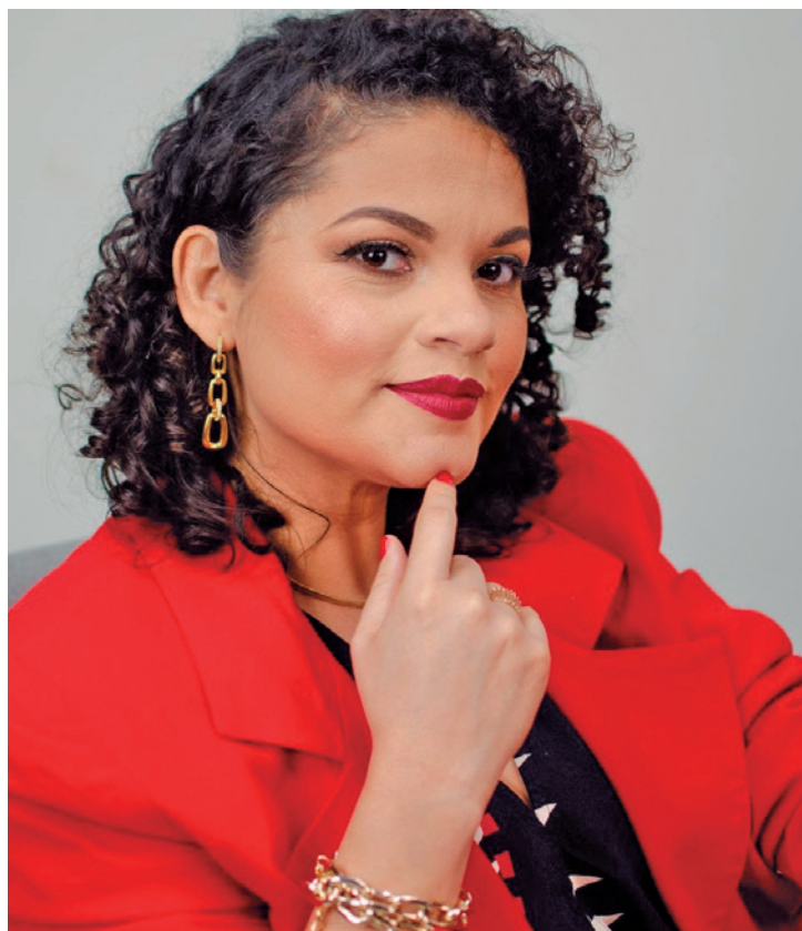
Autora: identidade e memória em “Essa Mundana Gente”

O Viva Usina traz outras atrações neste final de semana. O público poderá conferir o show Três Rios , com os DJs AcaraJow e Kamet e a artista Lama; será a partir das 20h, no Palco Bonde. Amanhã é a vez do Aruenda da Saudade, grupo cultural afro-indígena de Pitimbu. Eles se apresentam na sala Vladimir Carvalho, a partir das 19h. Todos os eventos do Viva Usina têm entrada franca.