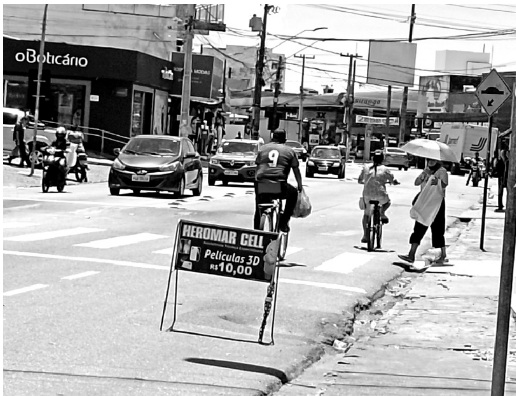
Nem todas as vias da capital têm faixas próprias para os que andam sobre duas rodas

Para classificação na segunda etapa, os candidatos participantes precisam ter alcançado no mínimo 64,277 do total de 100 pontos do exame da primeira etapa. A nota de corte foi divulgada no dia 29 de maio, por meio de edital publicado no Diário Oficial da União.