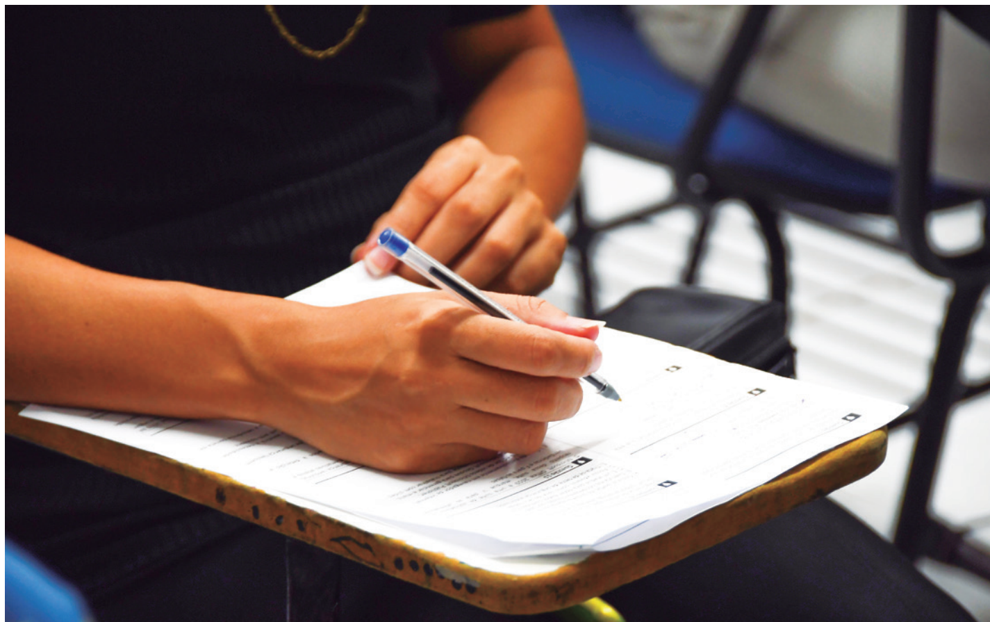
Inscrições para a seleção, organizada pelo Cebasp, começam no próximo dia 13; provas serão aplicadas em 1º de setembro