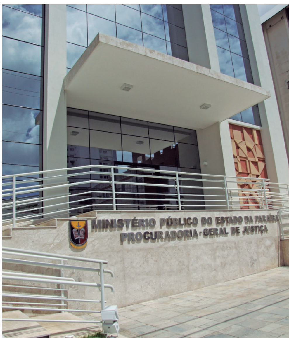
Processos contra o Município de Santa Rita criticam o uso de altos valores no evento

discricionariedade ilimitada no trato com a coisa pública. Deve o gestor agir com prudência e responsabilidade”.