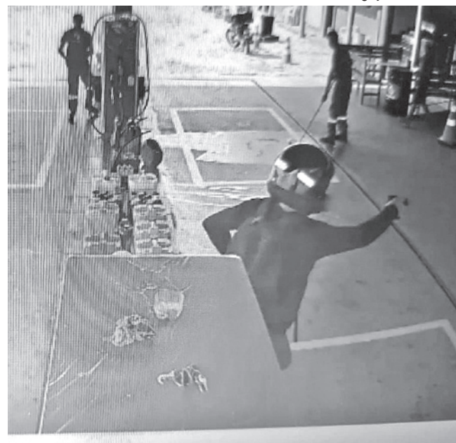
Postos de combustíveis também foram alvos dos ladrões