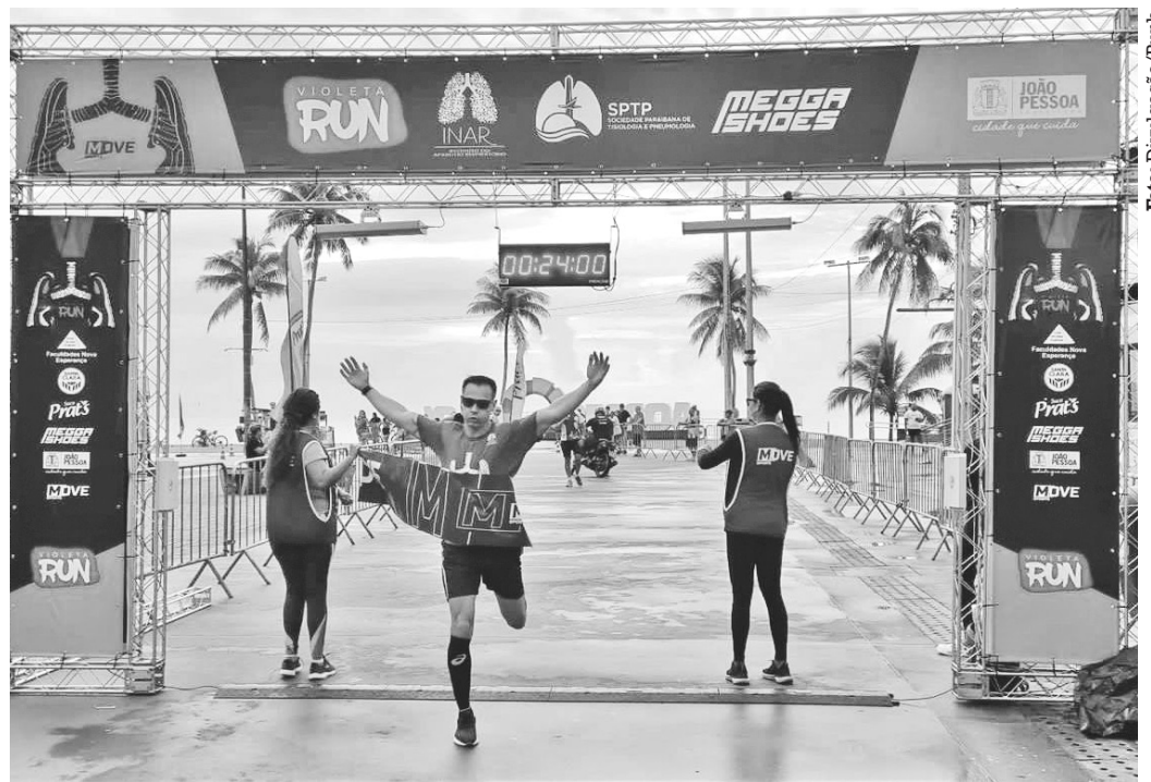
Flagrante de corredor na linha de chegada da edição passada do evento em João Pessoa

“A gente tinha a intenção de fazer algum evento de saúde respiratória para chamar a atenção da população e isso foi feito porque a gente ia ter um Congresso de Pneumologia em João Pessoa, em 2018, antes da pandemia. Quer dizer, a gente já estava preocupado com a questão respiratória, com o tabagismo, a