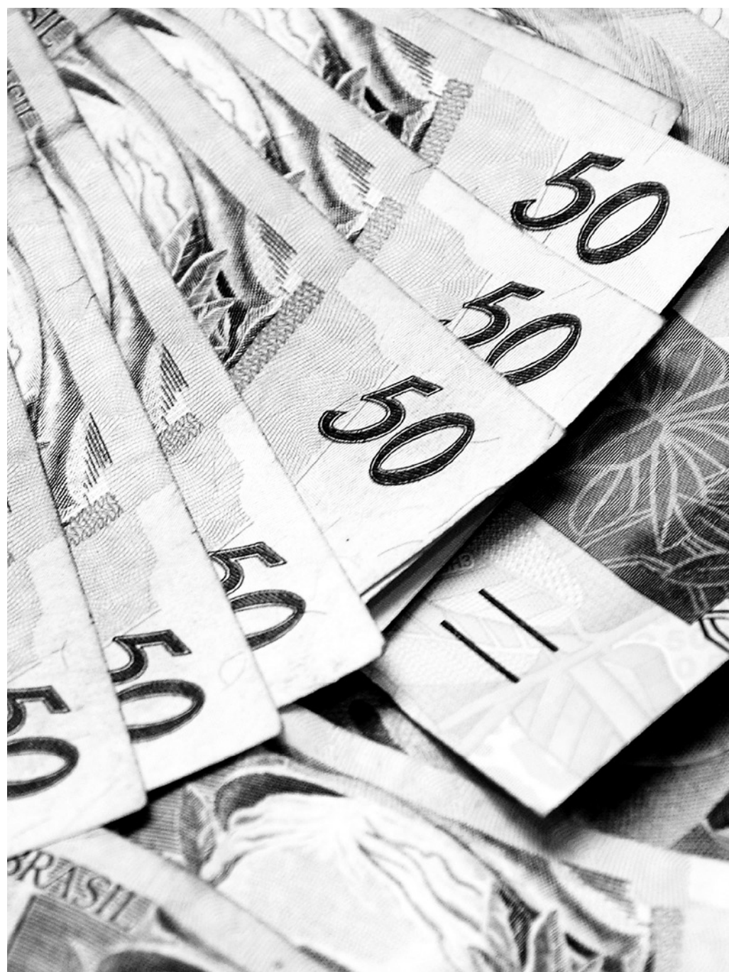
Sistema de Valores a Receber (SVR) já devolveu R$ 6,78 bilhões a 20 milhões de correntistas

Além dessas fontes, o SVR engloba os seguintes valores, já disponíveis para saques no ano passado. Eles são os seguintes: contas-correntes ou poupança encerradas; cotas de capital e rateio de sobras líquidas de ex-participantes de cooperativas de crédito; recursos não procurados de grupos de consórcio encerrados; tarifas cobradas indevidamente; e parcelas ou despesas de operações de crédito cobradas indevidamente.