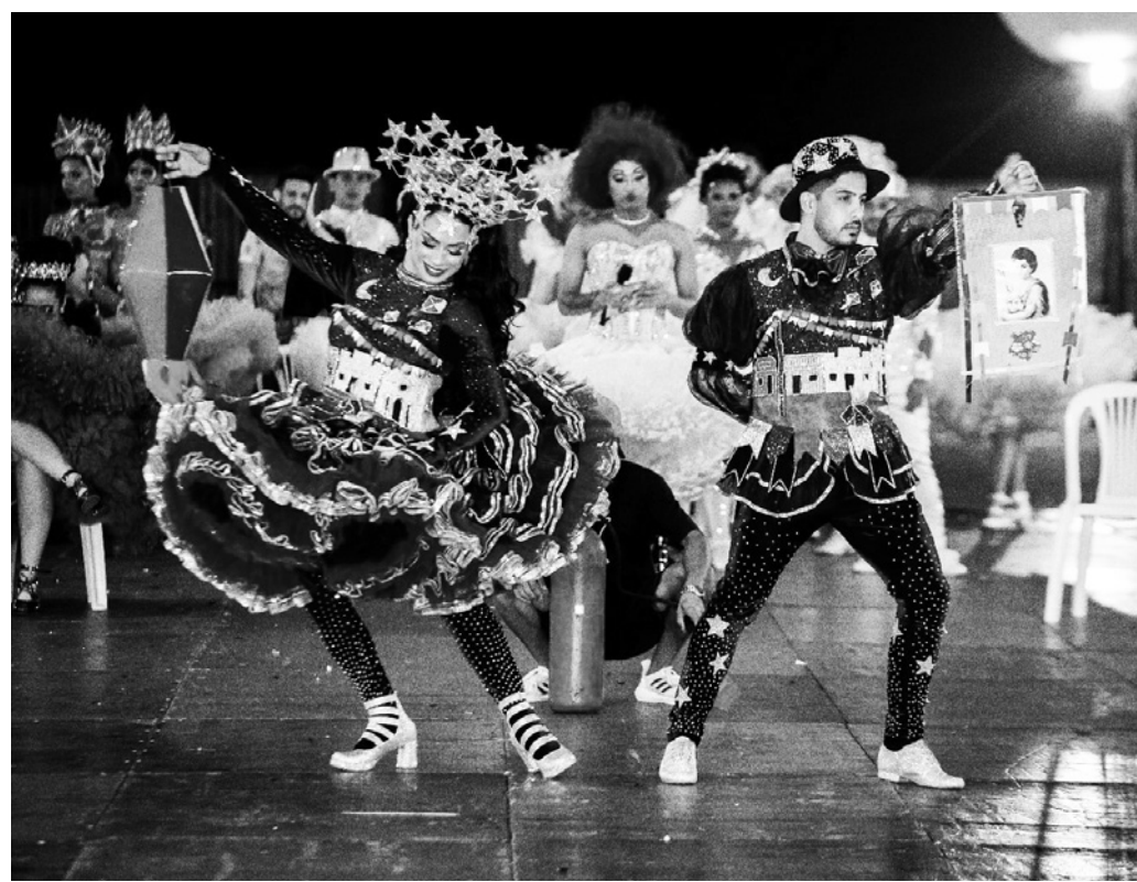
Além das quadrilhas, a programação também terá várias apresentações musicais