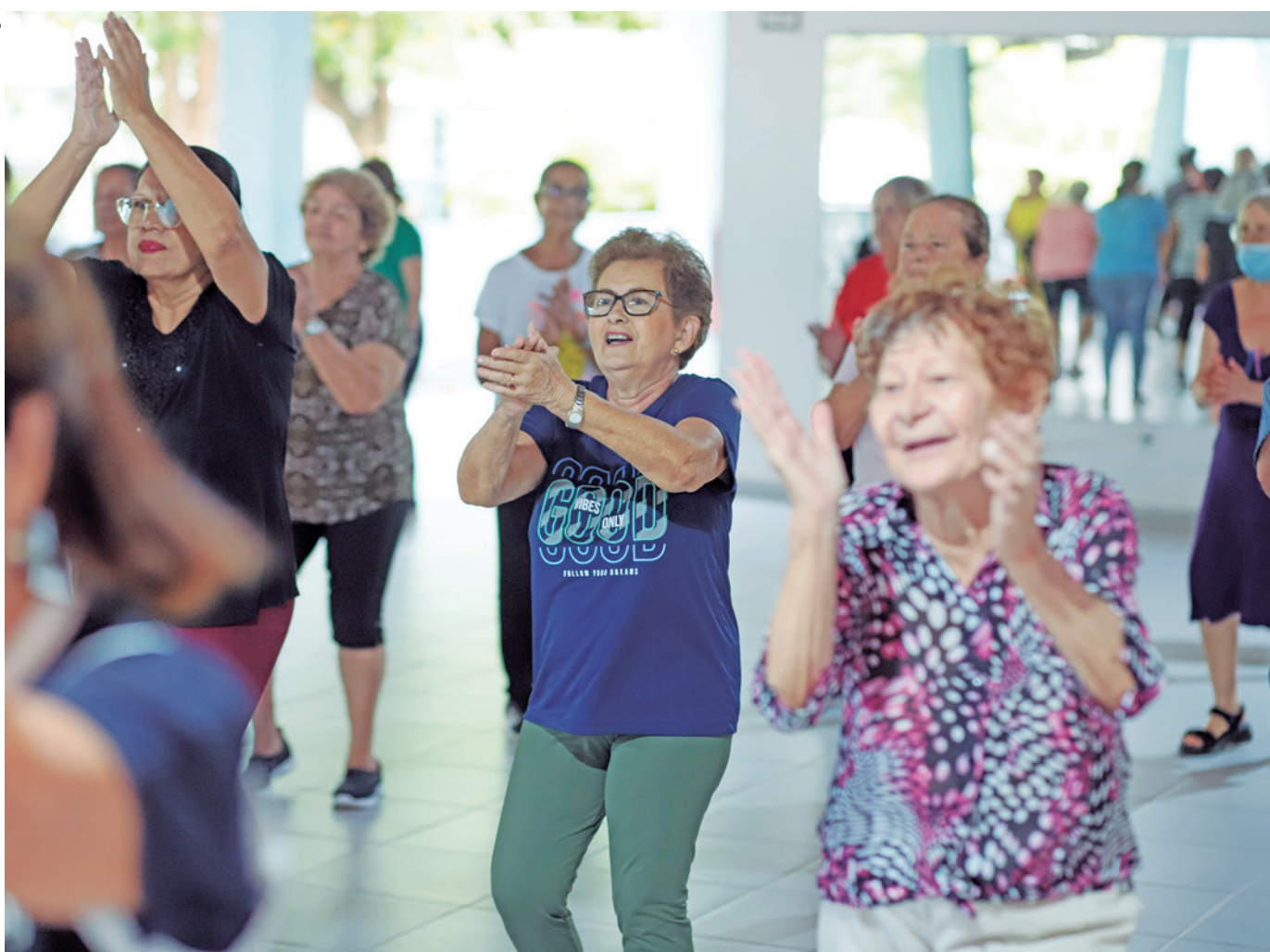
Todos que procuram atividades no espaço da pessoa idosa são acompanhados por profissionais em todos os momentos

hora tudo. Sem fazer nada fica travado, né? E a gente se movendo, dá uma melhora da boa mesmo”.