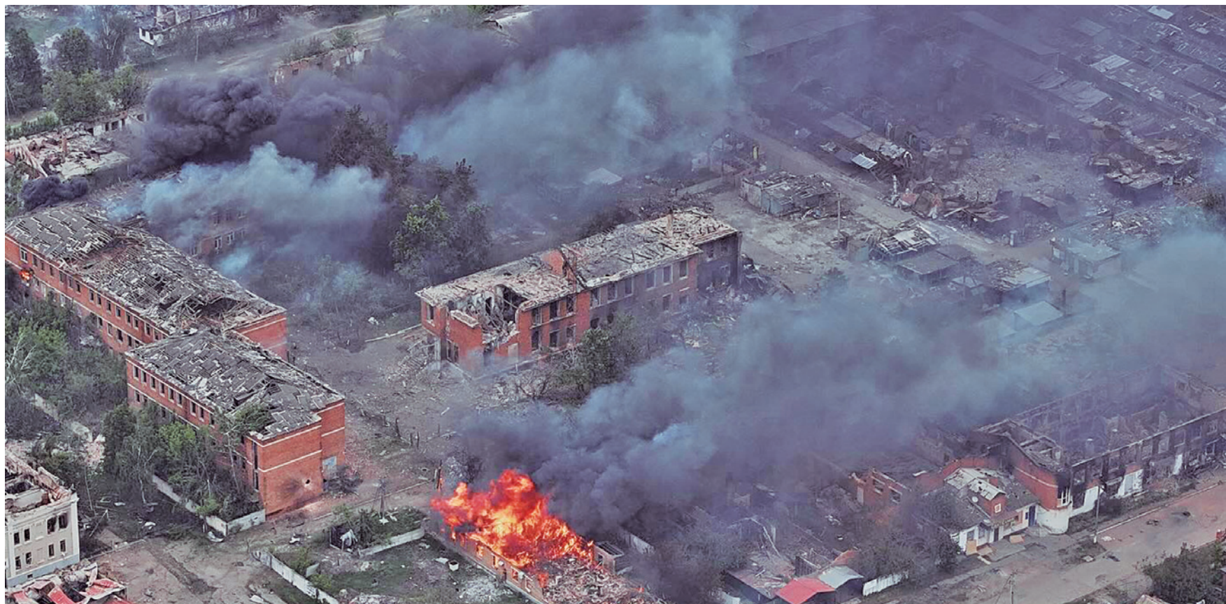
Metade das vítimas do mês passado foram atingidas nos ataques ocorridos em Kharkiv; desde o início da guerra, 11 mil civis foram mortos na Ucrânia

A estimativa é que acima de um milhão de crianças estejam entre os quase quatro milhões de deslocados internos e estas sejam "uma parte significativa dos 6,5 milhões de refugiados ucranianos registrados globalmente".