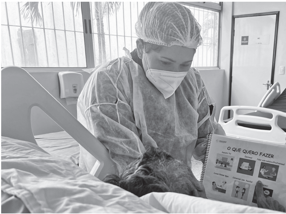
A prancha tem ilustrações que facilitam o diálogo entre pacientes e a equipe hospitalar