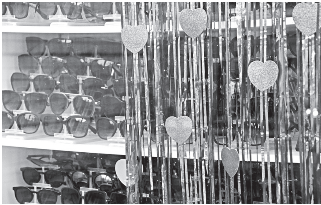
Amor à primeira vista