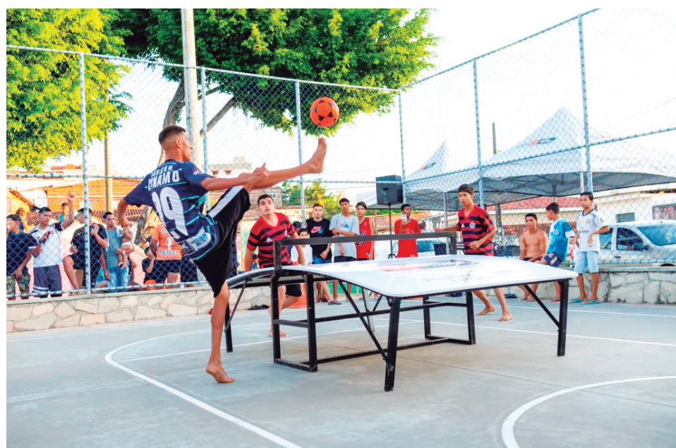
Competição acontece no Ginásio Neuza Gonçalves Brandão, reunindo 24 duplas

Utilizando uma mesa com uma rede e uma bola